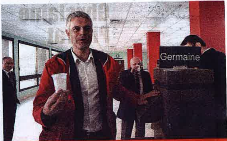
Laurent Wauquiez a goûté l'eau à la source, à Châtel-Guyon.

« On a une vraie puissance de frappe pour le thermalisme... » Laurent Wauquiez, président de la Région Auvergne-Rhône-Alpes, a lancé le Plan thermal 2016-2020, depuis Châtel-Guyon. Il veut faire d'Auvergne-Rhône-Alpes la région de référence sur le champ de la prévention santé, et la 1ère région thermique de France. Ce dispositif, doté de 20 millions d'euros, représente un engagement régional sans précédent. Il s'agit d'accompagner les stations thermales pour investir dans le retraitement des eaux, dans des piscines, des douches hydrojets... ou des aménagements urbains de mise en valeur de l'offre thermique. La modernisation des équipements doit permettre d'optimiser la fréquentation des stations thermales et d'accroître les créations d'emplois durables et de proximité dans ce secteur. Ainsi 2.000 emplois devraient être créés au total des 24 stations de la Grande région. Concrètement, 17 millions d'euros accompagneront les investissements de rénovation, et 3 millions d'euros seront réservés à la formation et à la promotion du