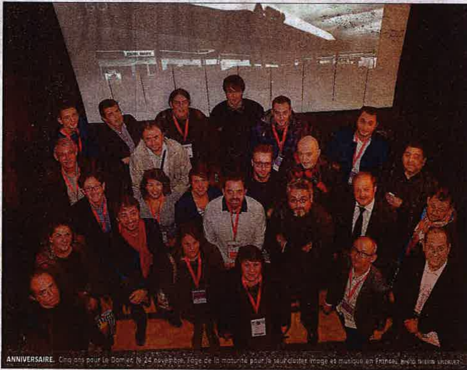
ANNIVERSAIRE. Cinq ans pour le Damier, le 24 novembre. Page de la maturité pour le seul cluster image et musique en France.

par trois adhérents du Damier - Films IN, Anaïs Productions et Pressop - on pourra depuis la salle des fêtes de Saint-Éloy-les-Mines, par exemple, poser une question à un universitaire comme si on assistait à son intervention dans l'amphithéâtre de la faculté à Clermont-Ferrand. Ou bien interroger à distance un artiste à l'issue d'une représentation. Le Damier a mis son réseau à disposition de « Ici Aussi » et a ouvert des portes aux partenariats financiers et opérationnels (avec les lieux culturels). Image, le nouveau pôle de création musique/image, à Cébazat, via ses groupes en résidence, servira de tremplin à la phase d'expérimentation.